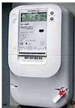
Box mit GPRS-Sender und PLC System