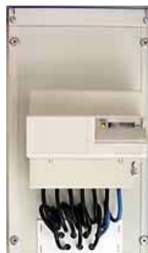
Box ohne Sender aber mit PLC System

Erste Wirkungen: Viele körperliche und seelische Beschwerden bei Menschen, ungeheure Schlafstörungen, andauernder kurzer Stromausfall, Lampen explodieren, Mobilverkehr teilweise zusammengebrochen, Telefone funktionieren nicht, Stromstärke und Strahlung in der Stromleitung unglaublich gestiegen, Computer knacken furchtbar, Internet und Mailverkehr humpelt, Lampen flackern die ganze Zeit usw. Auch die EI-Allergiker fallen haufenweise um und fühlen sich sterbend. Viele zeigen jetzt schon Persönlichkeitsveränderungen und andere Bewusstseinsstörungen, besonders im Bezug auf das Gedächtnis. Alles nur, wegen diesem kleinen Sender, der eigentlich keine Beeinflussung auf das Stromnetz haben sollte. ODER ?